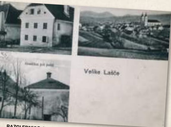
RAZGLEDNICO JE LETA 1917 V TRSTU ZALOŽIL VITTORIO STEIN; HRANI JO NUK.

Naslednji žig na začetku 20. stoletja ima tudi 'datumski most', to sta dve vodoravni črti v notranjem krogu, med njima pa je izpisan datum. Za mesece zdaj uporabljajo rimske številke (3. XII. 14); nemško ime pošte se ponovno spremeni, tokrat v Gross Laschitz. Na obodu se pojavi črkovna oznaka a. Ko po prvi svetovni vojni Slovenci pristanemo v Državi Srbov, Hrvatov