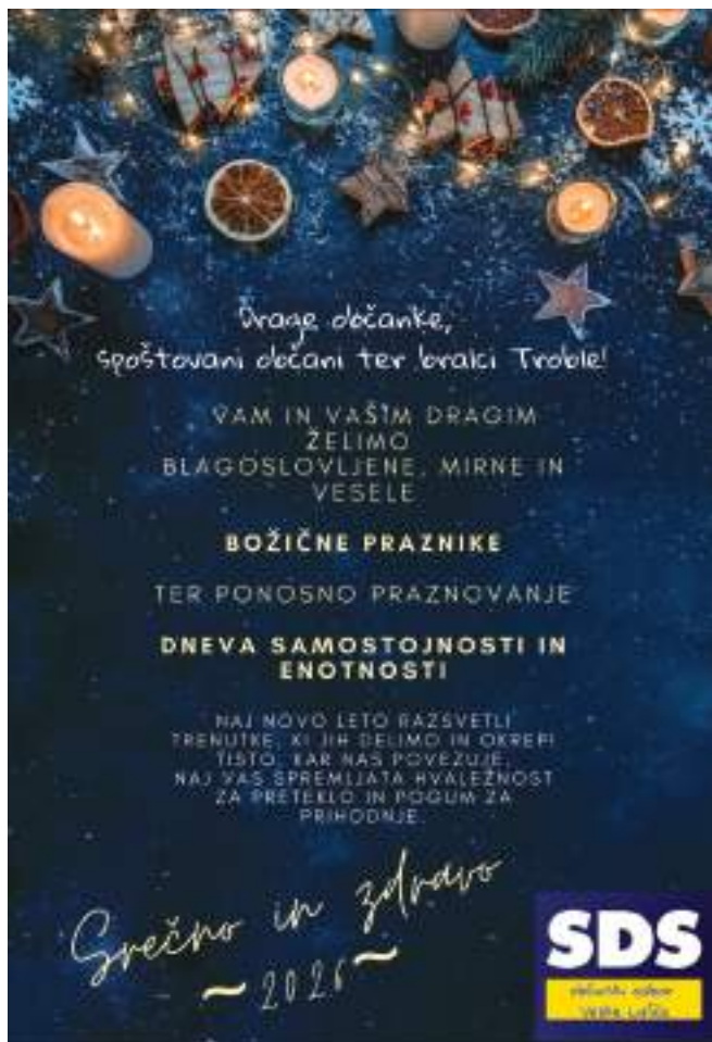
Naročnik oglasa je OO SDS Velike Lašče.