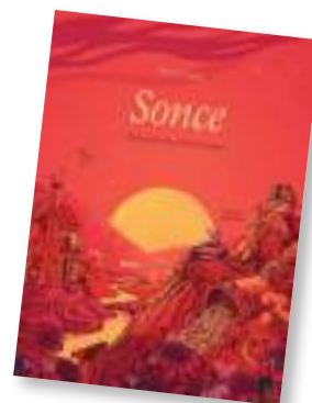
Mladinski oddelek Astronomija za mladino Peter Goes: Sonce – od sončnih bogov do teleskopov Morfemplus, 2024

V tej knjigi boste odkrili, kaj je Sonce pomenilo različnim kulturam skozi stoletja. Dobili boste odgovore na vprašanja: Kaj je svetloba? Kako nastanejo Sončevi blišči? Kakšen je življenjski cikel zvezde? Osupljive celostranske ilustracije v knjigi so polne pisanih zanimivosti o Soncu. Ustvaril jih je Peter Goes, avtor uspešnic Časovno potovanje in Reke . Sonce vidi vse nas, nihče pa ne more gledati vanj. Ob imploziji zvezda še enkrat vdihne, nato pa svoje zunanje plasti zaluča v vesolje. V njih so drobni delci, ki so gradniki vsega živega. Vsi smo torej narejeni iz zvezdnega prahu.