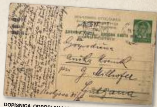
DOPISNICA, ODPOSLANA LETA 1939.

Ker železniška postaja v Laščah ne stoji v centru, so se po pošto odpeljali z zapravljičkom, v katerega so vpregli konjskega lepota. Ta je pripeljal pošto do poštnega urada, kar prikazuje tudi fotografija