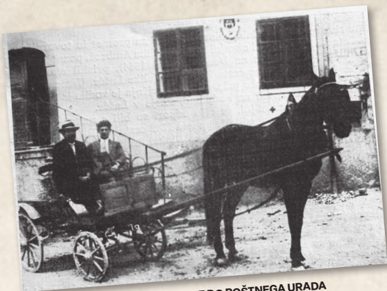
POŠTO JE Z ŽELEZNIŠKE POSTAJE DO POŠTNEGA URADA PRIPELJALI KONJSKI LEPOTEC.

I. (1830-1916). S tem vladarjem je v drugi polovici 19. in na začetku 20. stoletja močno povezana vsa slovenska zgodovina, kot tudi vse kulturno, politično, gospodarsko in družbeno življenje v Evropi. Vladal je 68 let, kar je več kot katerikoli evropski vladar v novejši zgodovini.