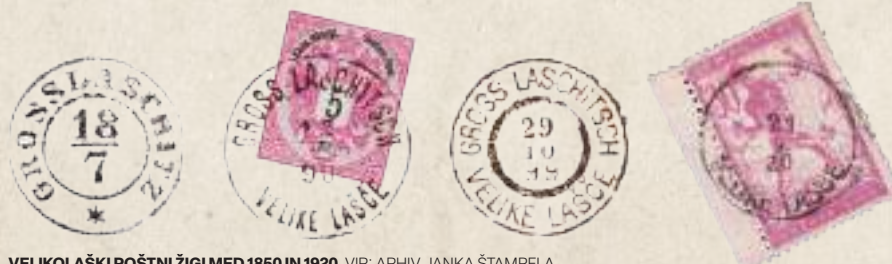
VELIKOLAŠKI POŠTNI ŽIGI MED 1850 IN 1920.