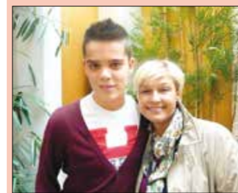
Hvala, ker ste si vzeli čas zame in odgovorili na moja vprašanja.

Pesmi sem napisala nekaj, bolj pa sem se našla v pisanju razmišljujoče proze. V svoj dnevnik še danes kaj zapišem, a redkeje, kot bi si želela, saj mi časa vedno manjka. Rada pa veliko berem, tudi očetove pesmi in prozo rada vzamem v roke. Branje leposlovja se mi zdi zelo koristno. Če bereš, se učiš lepega izražanja, bogatiš si razum in duha. Zato se mi zdi pouk slovenščine v šoli in spodbujanje k branju zelo pomembno.