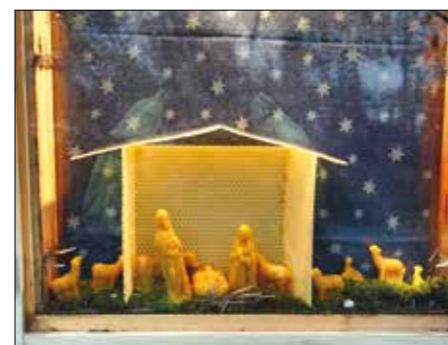
Iz čebeljega voska