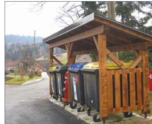
Ekološki otok Hrastinjaki