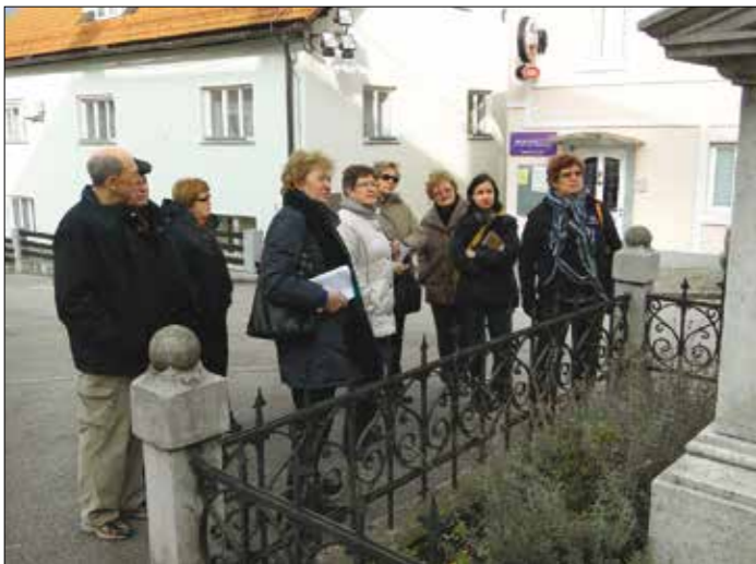
Ogled razstave Velike Lašče – Villa Lasis je trg postala in središča Lašč.