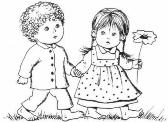
Ilustracija: Jelka Reichman

Število rojstev je bilo v letu 2013 nekoliko nižje kot v preteklih letih. Denarna pomoč ob rojstvu otroka v višini 500,00 EUR je bila izplačana za 48 novorojenčkov (v letu 2012 za 54).