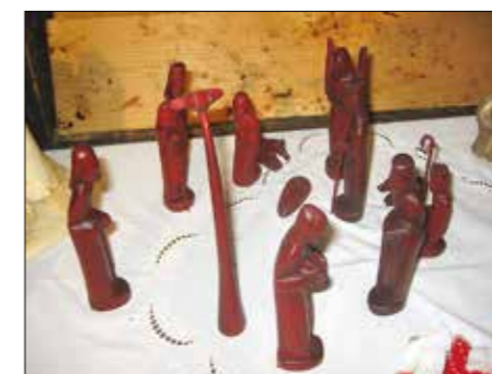
Iz mangovca iz Kenije