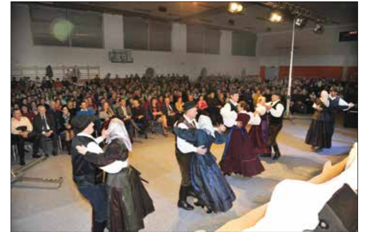
Plesalci velikolaške folklorne skupine.

Navihanke so navihana dekleta, ki spretno izvabljajo poskočne melodije iz svojih instrumentov. S svojo mladostno razigranostjo in simpatičnostjo so ogrele polno dvorano in požele velik aplavz.