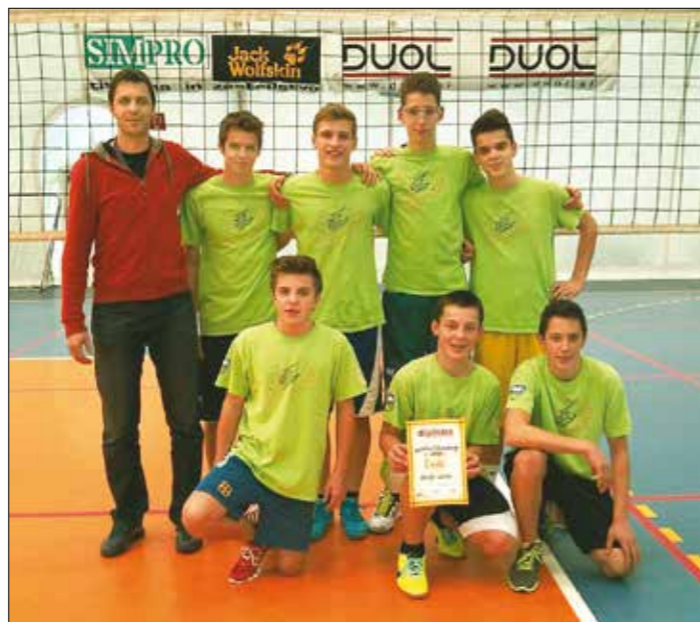
Šolska odbojarska ekipa, ki se je kot druga v zgodovini uvrstila na državno četrtfinalno tekmovanje

in na Brezovici premagali OŠ Horjul (2 : 0) ter precej gladko izgubili z domačini z enakim izidom. Kot drugouvrščena ekipa smo se udeležili tudi področnega tekmovanja in 16. 1. na Brezovici najprej premagali OŠ Stara Cerkev (2 : 1), nato pa z enakim rezultatom še OŠ Dobropolje. Na koncu smo z odlično igro namučili še domačine ter se jim skoraj oddolžili za poraz na medobčinskem tekmovanju. Zmanjkalo je nekaj sreče, domačini so osvojili ključne točke in osvojili prvo mesto. Naša pot se nadaljuje, saj smo se kot drugouvrščena ekipa uvrstili na državno četrtfinalno tekmovanje, kjer se bo pomerilo 27 najuspešnejših slovenskih osnovnih šol. S tem smo ponovili uspeh izpred dveh let.