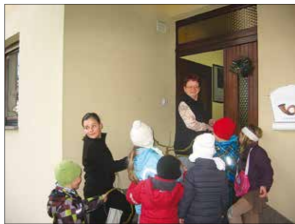
Ena žrtev ...

V sedanjem času se je odnos do tega običaja tudi zaradi drugačnega razumevanja in odnosa do fizičnega nasilja (ki je pravzaprav nesprejemljivo)