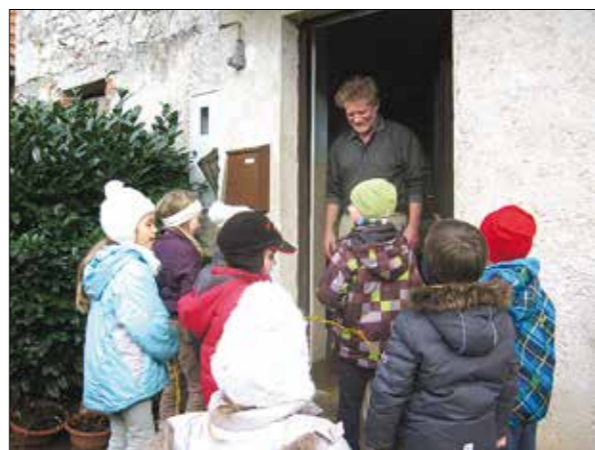
Pa druga ...