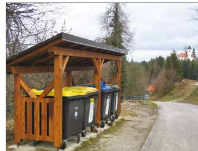
Ekološki otok Lužarji