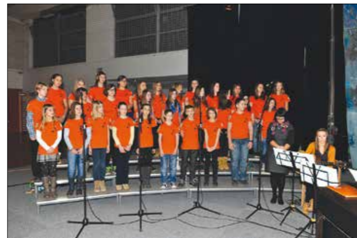
Mladinski pevski zbor OŠ Primoža Trubarja Velike Lašče