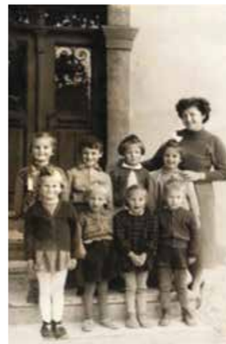
Pirkovičeva hiša