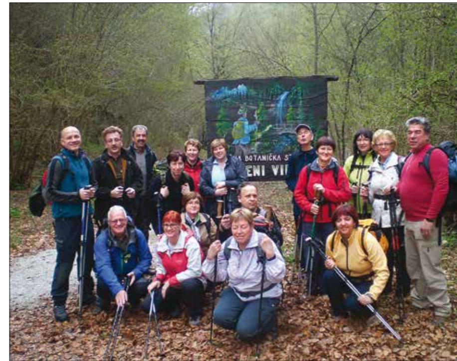
Slika s pohoda po Poučni botanični poti Zeleni vir –izhodišče Brod na Kolpi.

Štirinajst dni zatem se nas je šestnajst pohodnikov odpravilo iz doline Zadnjice v Trenti čez Prehodavce in po Dolini Sedmerih jezer do Koče pri Sedmerih jezerih in tam prespali. Drugi dan smo se preko Tičarice in Fužinskih planin odpravili v Bohinj. Planinska tura po eni izmed najlepših dolin v naših hribih je bila za marsikoga nepozabna. To je bil začetek našega hribolazenja.