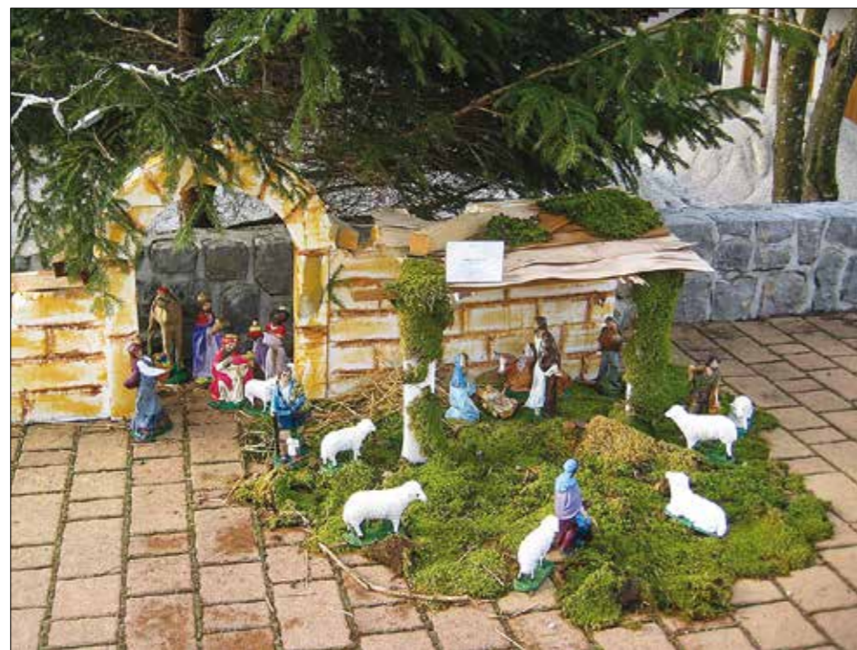
V vaškem središču

Razstava je potekala od 15. decembra 2013 do 5. januarja 2014. Najbolj pravično je bilo vse nedelje ob 17.30, ko bil organiziran voden ogled v soju bakel in ob petju božičnih pesmi.