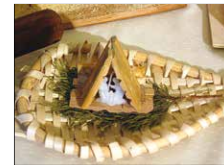
Miniature s čudovito dekoracijo

Tako so izdelane iz betona, kamna, keramike, stekla, glin, porcelana in mavca, lesene so izrezljane ali izžgane, nekatere so oblikovane iz voska, druge izrezljane ali poslikane papirnate, narisane ali nalepljene na vaških oknih ... Najnežnejše so iz tekstila, kvačkane ali pletene, manj obstojne iz testa, bučk in drugih plodov ter koruznih storžev. Za razstavo je bilo seveda uporabljenega še mnogo drugega materiala za okrasitev in celostno postavitev posameznih jaslic: mah, lubje, storži, borove in orehove lupine, veje in debla, stiropor ... Hlevček so simbolično predstavljali najrazličnejši predmeti, kot na primer vrček, sodček, buča, storž, kamen z Viševnika ter celo nojevo jajce in kokosov oreh. Tudi letos so ob nedeljah škocjanski skavti postavili žive jaslice, v naravni velikosti so bile tudi jaslice iz slame in tekstila.