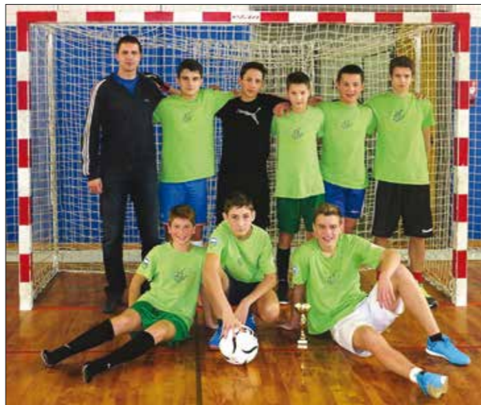
Nogometaši po medobčinskem tekmovanju

Rezultati so se stopnjevali, največji uspeh smo tako dosegli na odbojškem tekmovanju. Ta so specifična, saj razen na Brezovici nikjer ne delajo v klubih. Tako se res pomerijo »rekreativni« igralci in prikažejo znanje, ki ga večinoma usvojijo v šoli. Medobčinskega tekmovanja smo se udeležili v decembru