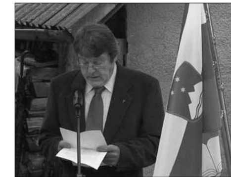
Zgodovina dogodkov v času NOB