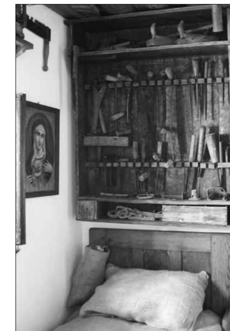
Pečnica