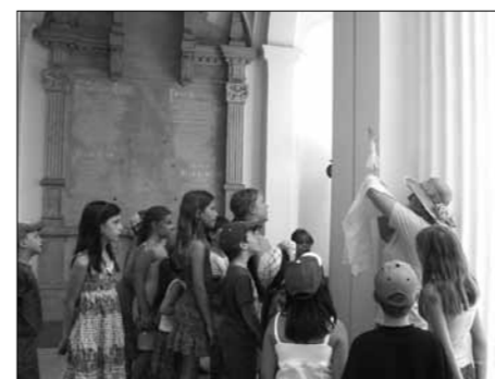
S pravljico smo prišli prav do Levstikovega spomenika na Navjah.

Zavod za razvijanje ustvarjalnosti sodeluje v projektu ljubljanskega Združenja za starše in otroke Sezam z naslovom Še so z nami. Ta projekt, pri katerem poleg Sezama in ZRU sodeluje tudi Društvo Rastoča knjiga, sestavlja mozaik bogate ponudbe mesta Ljubljane, letošnje svetovne prestolnice knjige. V severnem mestnem parku Navje je ZRU poleg štirih tematskih pesniških večerov (klasične oblike, kratke oblike, angažirana poezija in prevodi) z avtorji in urednicami portala Pesem.si za otroke pripravil tudi ustvarjalne delavnice na temo knjige, branja in literature.