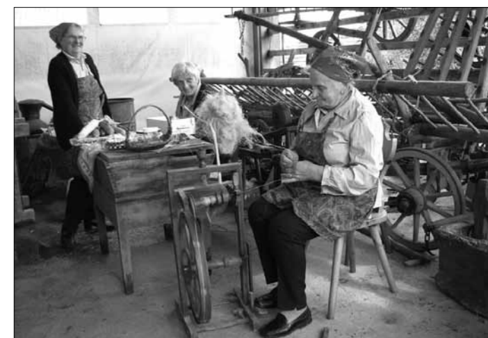
Pri zbirki starega orodja pod kozolcem

Prireditve sta z napevi starih pesmi popestrila gostujoči moški pevski kvartet Zvonček in domače "Suhe češplje". Pod kozolcem, kjer je na ogled postavljena stalna razstava starega kmečkega orodja, so domače žene obiskovalcem prikazovale, kako so same nekoč izdelovale klince, predpražnike iz ličkanja, naglavne svitke in drugo, še vedno spretne predice pa so na starem kolovratu demonstrirale prejo lanene preje. Glede na bogato letino sliv in jabolok je tudi v času prireditve s polno zmogljivostjo delovala vaška sušilnica sadja.