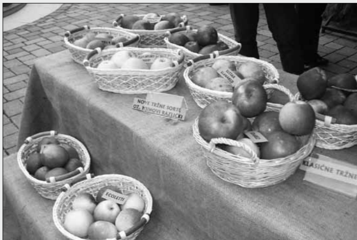
Razstava starih sort jabolok