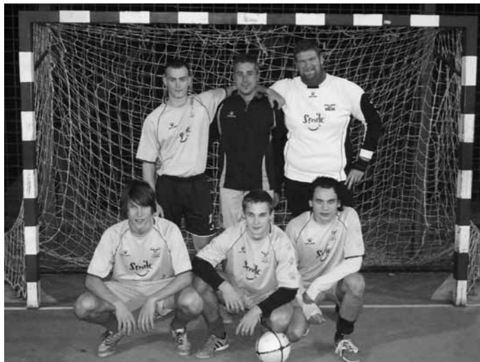
Prvaki ekipa ŠMD Turjak

Z odigranim 18. krogom se je 13. oktobra končala letošnja občinska liga v malem nogometu občine Velike Lašče v organizaciji ŠD NK Velike Lašče.