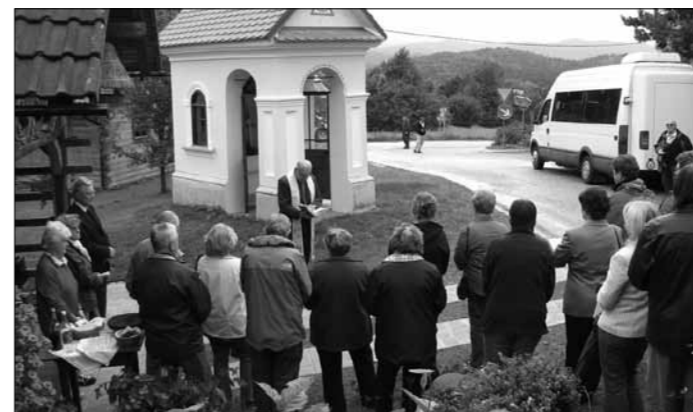
Blagoslov obnovljene kapelice

Zaradi močno razmočenih tal so bili s tradicionalnega programa sicer prisiljeni umakniti izvedbo pohoda po "Trubarjevi rojstni fari", so pa letošnjo prireditev obogatili z izvedbo blagoslovitve obnovljene kapelice Matere božje na Gradežu in odprtjem na novo urejenega vaškega središča.