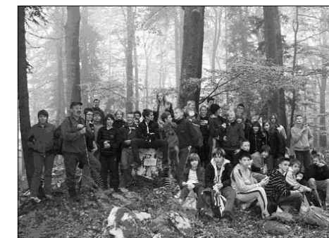
Skupinska fotografija na vrhu

V četrtek, 14. 10. 2010, so imeli na OŠ Primoža Trubarja učenci od 6. do 9. razreda športni dan. Vsebina je bila jesenski pohod. Zadnja leta smo