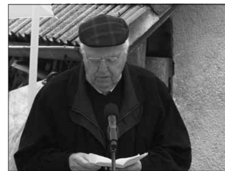
Pozdrav borcev Levstikove brigade, foto: Niko Samsa

Kot da bi se vedelo vnaprej, je po dveh dneh prenehalo deževati. Sprva je hladno zapihalo, nato pa se je med koprenastimi oblaki pokazalo celo sonce,