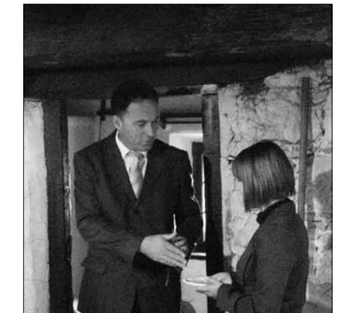
Ob odprtju pečnice

- ustanovitelju Občini Veliki Lašče, ki skrbi za investicijsko vzdrževanje domačije;